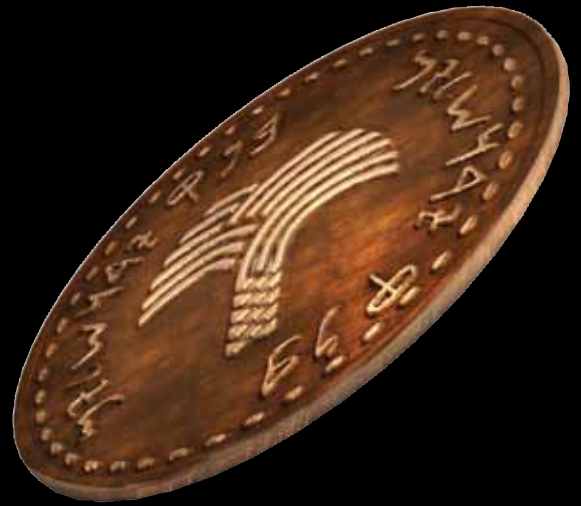
עיצוב: סטודיו 'שחר שושנה' מקבוצת 'סקורפיו 88' נדפס בדפוס העיר העתיקה, ירושלים.